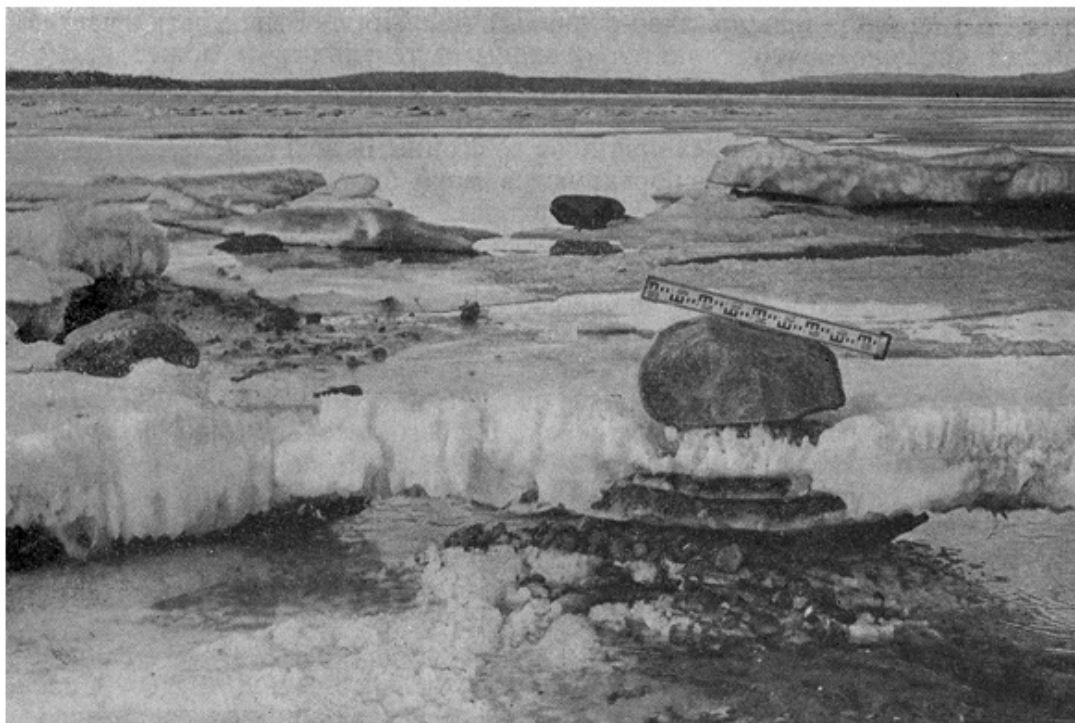
Рис. 2. Валуны и более мелкий материал на поверхности и в донной части льда. Льдины мористой части припая вынесены приливом на подошву припая, примороженную к грунтам. Длина масштабной рейки 0,9 м. Отлив

Принято считать, что разрушение выходов коренных пород происходит путем выветривания. В определенной мере это так, но важную роль в поставке глыбового материала играют тектонические движения по разломам. Разрушение сильно трещиноватых смещенных блоков пород и дает основную массу глыбового материала, который несет ясные следы тектонического дробления - зеркала скольжения со штриховкой на плоскостях, следы скалывания. Разрывные тектонические смещения в Кандалакшском заливе происходят и в настоящее время, на что указывает и сравнительно высокая сейсмичность Кандалакшского грабена.