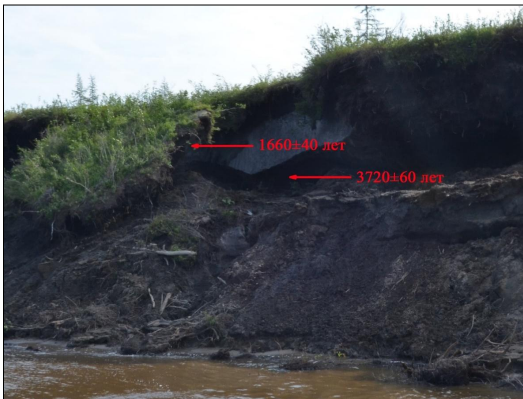
Рис. 2. Обнажение слоенки и ее возраст за перекатом Шайтан

растительным детритом, ветками и древесиной. Под слоёнкой мощностью до 1,5 м вскрывается продольная (параллельная берегу) жила и три поперечных, сросшихся с продольной жилой, уходящие вниз под обвалившийся осадок. Высота обнажения в целом 8,5 метров, низ которого представляет собой обвал и осыпь, достигающие 4,5 метров в высоту над урезом. Результаты датирования верхней 4-метровой толщи следующие: на высоте 7 м – 1660 \pm 40 лет (ЛУ-9404), на высоте 5,6 м, под жилой – 3720 \pm 60 лет (ЛУ-9405). Верхняя часть слоёнки над жилой залегает сплошным пластом с содержанием органики до 80%, а ниже жилы органика сосредоточена в линзах.